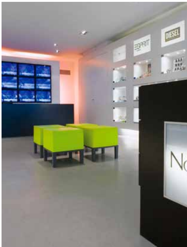
FOTO BOVEN RECHTS Interieur woonhuis annex atelier in Oisterwijk (ontwerp gebouw M30 Architecten)