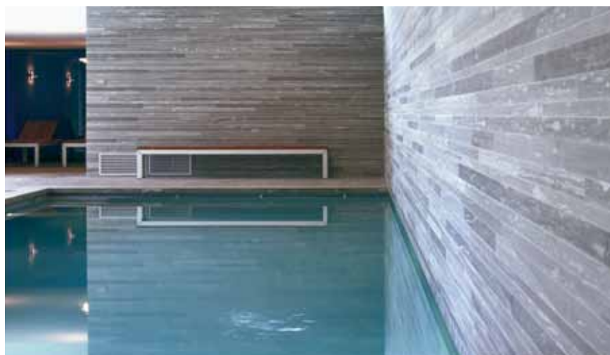
FOTO ONDER Interieur van een binnenzwembad bij een woonhuis

FOTO BOVEN RECHTS Interieur bedrijfsverzamelgebouw in Oosterwijk (van M30 Architecten)